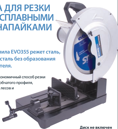
Диск не включен

Самый чистый, быстрый и наиболее экономичный способ резки мягкой стали. Идеальна для резки коробчатого профиля, брусьев, чугунных труб, строительных лесов и металлических конструкций.